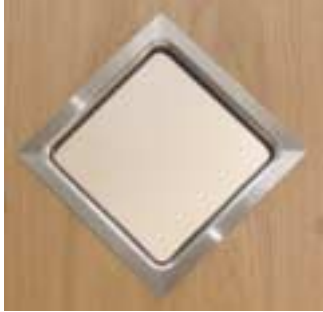
Edelstahl Viereck Spitzenradius 5 mm