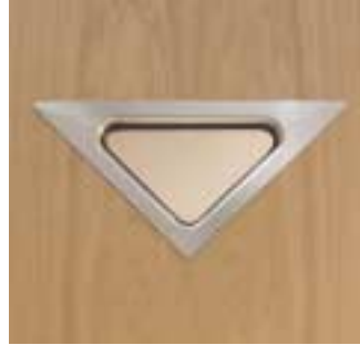
Edelstahl Dreieck Spitzenradius 5 mm