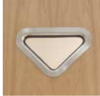
Edelstahl Dreieck abgerundet Außenradius 44,5 mm