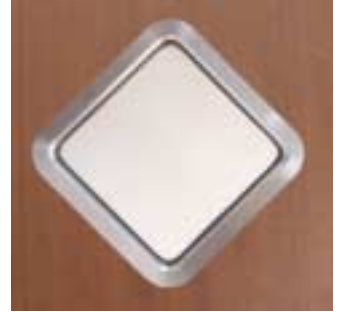
Viereck abgerundet Außenradius 44,5 mm